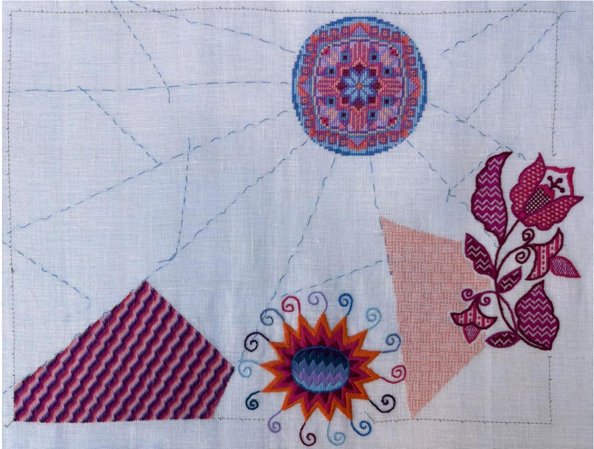
MMM 2026 deel 4 Hongaars bargello